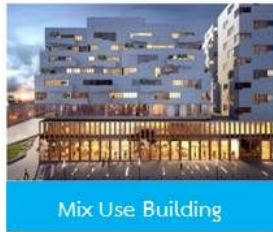
Mix Use Building

การใช้ประโยชน์ที่ดินแบบผสมผสาน การส่งเสริมความหนาแน่น การผสมผสานอาคารแนวตั้งและแนวนอน